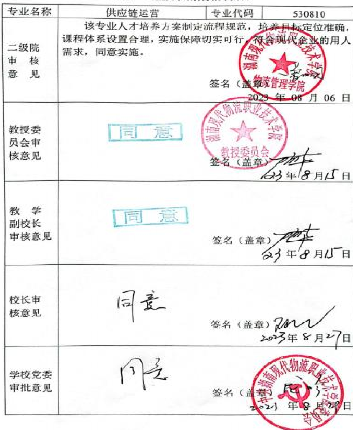
附表 7 专业人才培养方案审批表