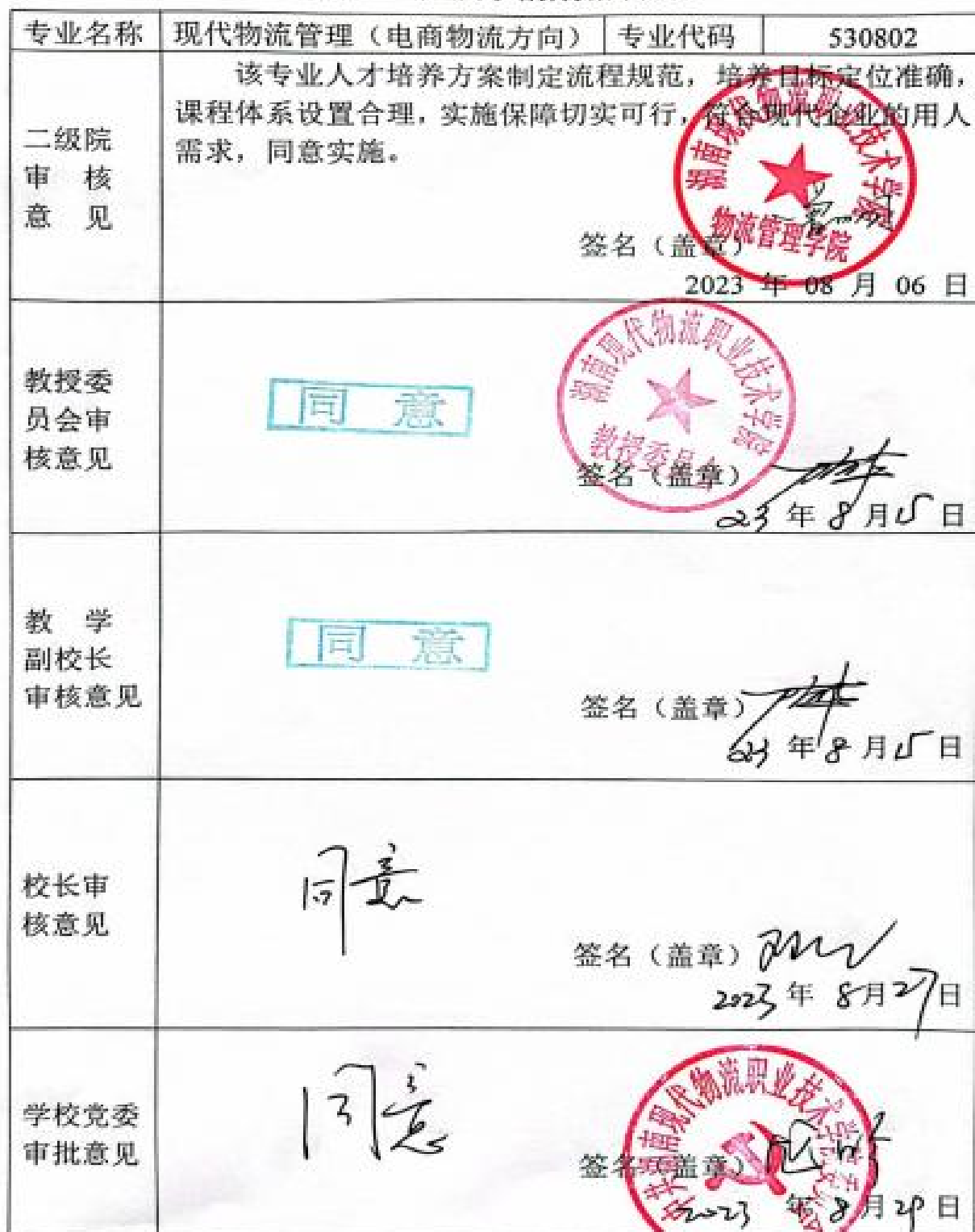
附表 7 专业人才培养方案审批表