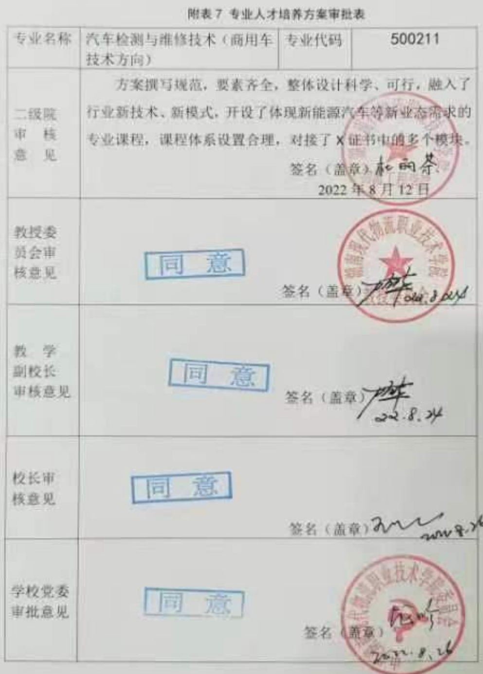
附表7 专业人才培养方案审批表