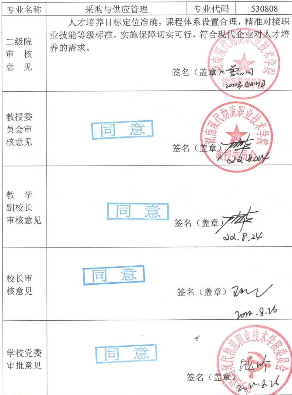
附表7 专业人才培养方案审批表