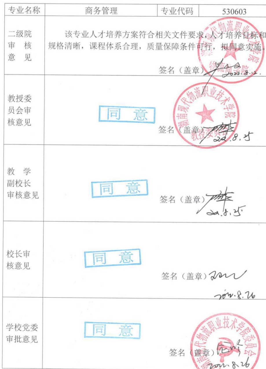
附表 7 专业人才培养方案审批表