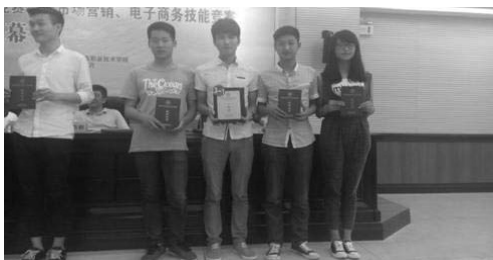
湖南现代物流职院学生上颁奖台领奖

2015 年 5 月 10 日，由湖南省教育厅主办、湖南商务职业技术学院承办的湖南省高职院校“市场营销技能大赛”全省总决赛经过一天时间的激烈角逐，在湖南商务职业技术学院落下帷幕并举行了颁奖典礼。