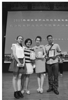
选手与指导老师合影